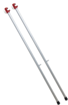
Poste para montaje en seguridad del parapeto. (2 und.)