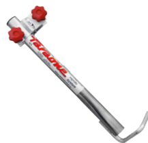
Fijación a pared. Fixação na parede.