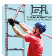
Curso de formación sobre el montaje. Curso de formação sobre montagem.