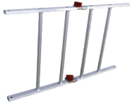
Sistema de pliego. Sistema de dobragem.