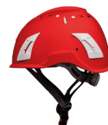
Casco de seguridad. Capacete de segurança.