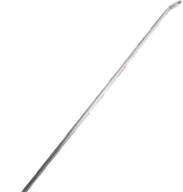
Diagonal base. Diagonal base.