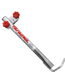
Fijación a pared. Fixação na parede.