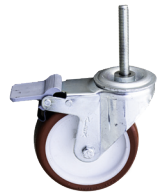
Rueda de 12,5 cm. con freno. Roda de 12,5 cm com travão.