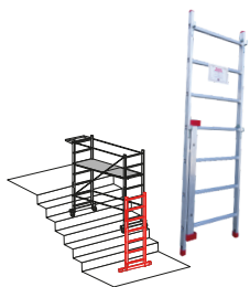
Kit escalinatas. Kit escadarias.