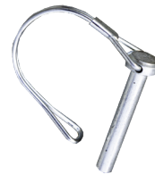
Gancho pasador. Gancho de fecho.