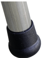
Tapón exterior de 4 cm de diámetro. Tampa exterior com 4 cm de diámetro.