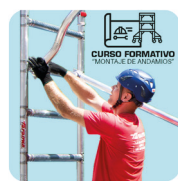
Curso de formación sobre el montaje. Curso de formação sobre montagem.